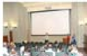
en la Parrquia del Espiritu Santo De Santa Helena 17448 Fremont Blvd., Fremont, CA 94558 (510) 416-0774