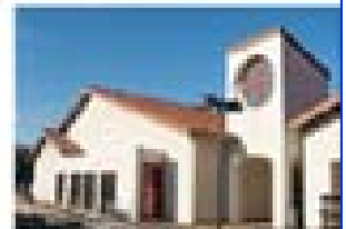
Holy Spirit Church De Santa Helena 17448 Fremont Blvd., Fremont, CA 94558 http://www.holyspirit.net