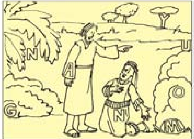
Saint Elizabeth Church Parroquia de Santa Isabel